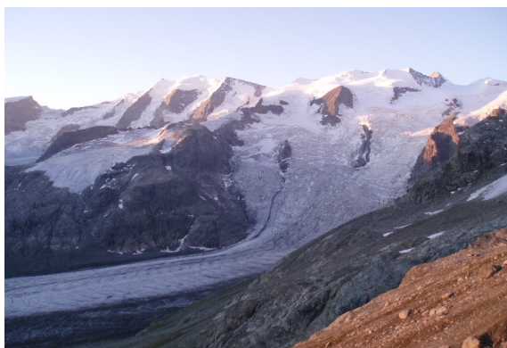
Vadret da Morteratsch en été il y a 15 ans